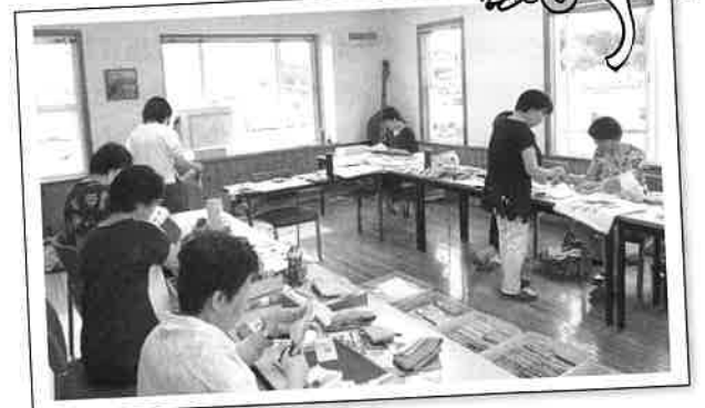
▲会議室利用中の手芸クラブの皆さん